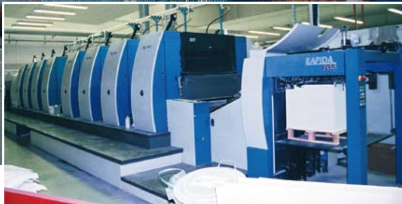
Förra året investerade Alfa Print i en ny KBA Rapida 105 offsetpress, vilket blev företagets femte Rapida. På bilden syns den näst senaste, nu 2,5 år gammal.