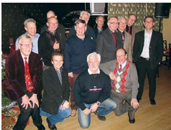
Det glada gänget hade ett kreativt möte om intressanta studiebesök. P-A

Efter mötesförhandlingarna fick vi ta del av det fantastiskt fin(-sk-)a julbordet som dukats upp av finska föreningens personal. Stämningen var på topp och det var en munter samling som efter maten traditionsenligt berättade historier, både sanna och osanna, skrattade och sjöng så taket lyfte.