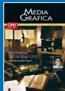
Miljöbild från ca år 1400. I förgrunden syns den italienske humanisten och publicisten Aldus Manutius arbete.